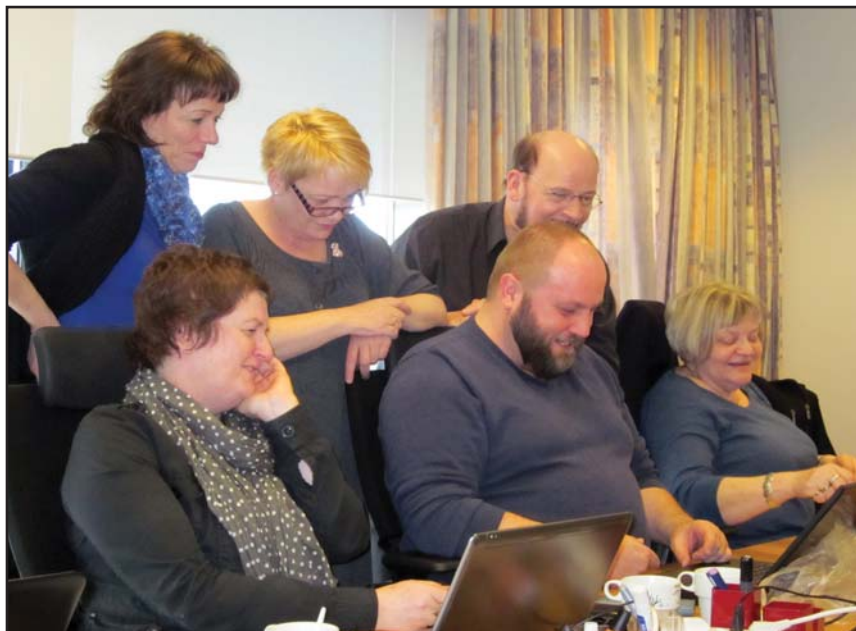
Stundum er kátt í Karphúsinu. Það fylgir ekki sögunni hvað það var sem gladdi samninganefndarfélagið, en greinilegt er að þarna er slegið á léttu strengi.

Það getur verið símtalsins virði að kanna hvort greiðslurnar skila sér og hvaða réttindi þær veita.