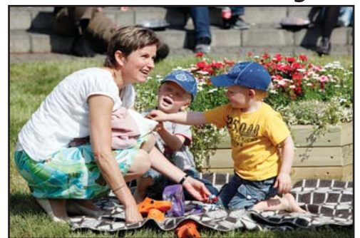
Veðrið er alltaf gott á Akureyri

Íbúðin er í hjarta bæjarins þar sem stutt er í sundlaug Akureyrar og miðbæinn. Á Akureyri er alla mögulega þjónusta að finna, einnig er þar ríkt menningarlíf. Þar er nyrsti 18 hólú golfvöllur í heimi, Jaðarsvöllur. Kjarnaskógur er fjölbreytt útivistarsvæði með alhliða möguleikum til hollrar úti-