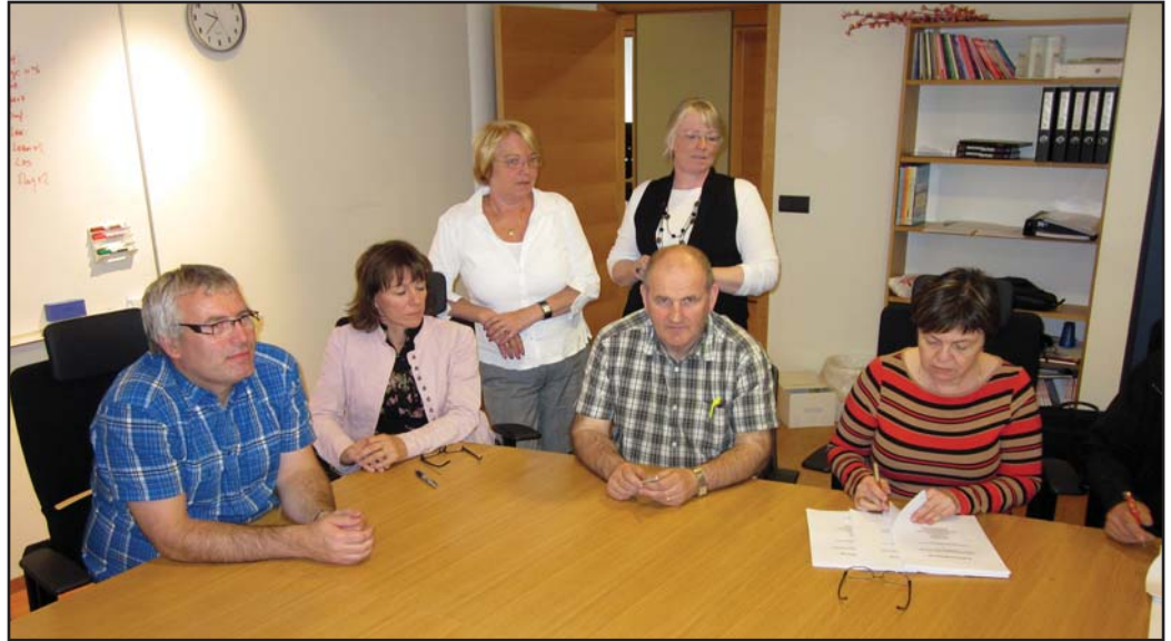
Kjarasamningur við sveitarfélögin undirritaður eftir langa vökunótt.

eða fæðingarorlofsgreiðslum á meðan. Þá er einungis um að ræða greiðslur frá félagsmanninum í félagssjóð. Hvorki Atvinnuleysistryggingasjóður né Fæðingarorlofssjóður greiðir mótframlög í sjúkra, orlofs eða fræðslusjóði