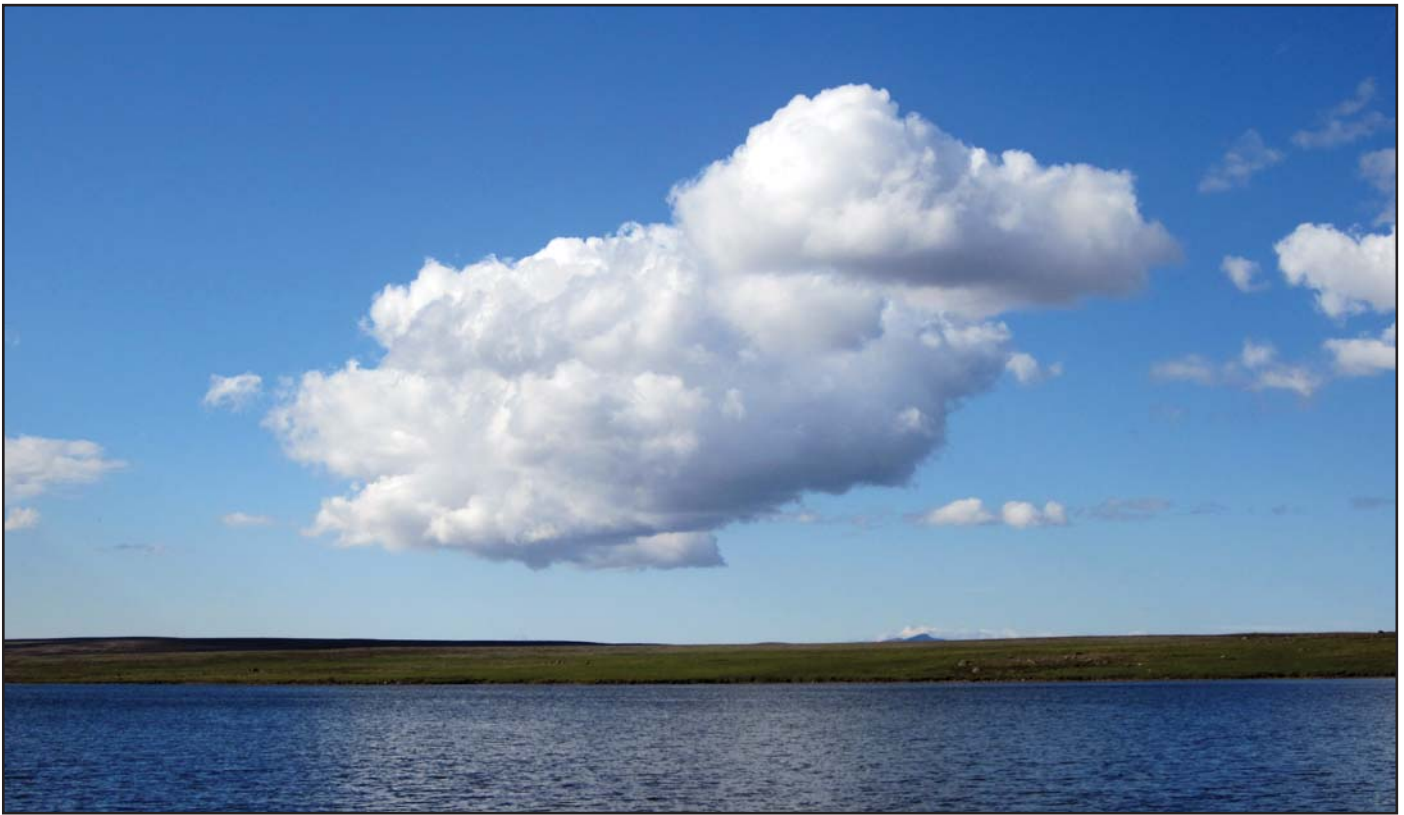
Góðviðrisský á Arnarvatnsheiði