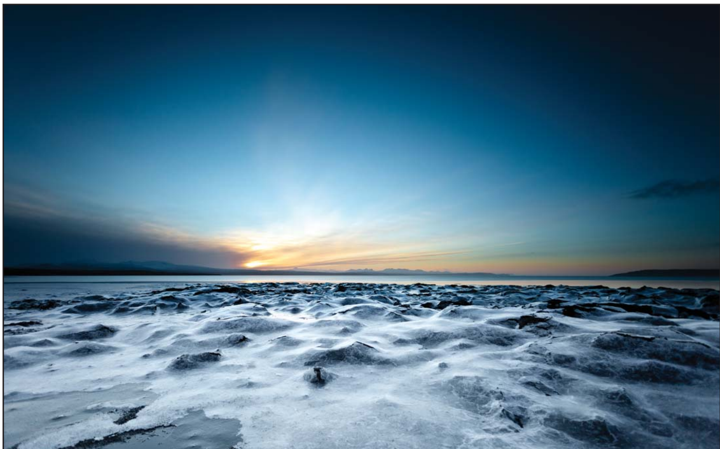
Ísteppi. Myndin er tekin í Hvammsfirði, Ljósufföll í fjarska.